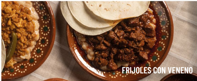
FRIJOLES CON VENENO