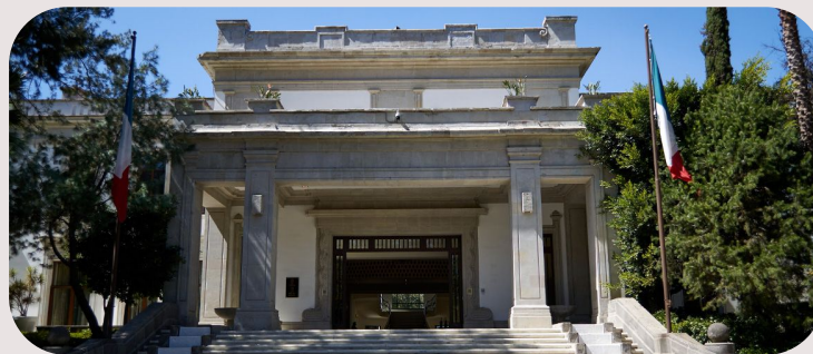
CASA MIGUEL ALEMÁN