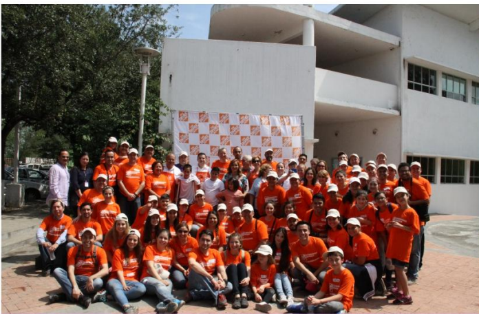
Se ha logrado hacer en conjunto con empresas una sinergia, involucrándolas a contribuir con la sociedad.