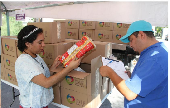
En esta administración se entregaron por primera vez los apoyos directamente a los beneficiarios sin intermediarios.