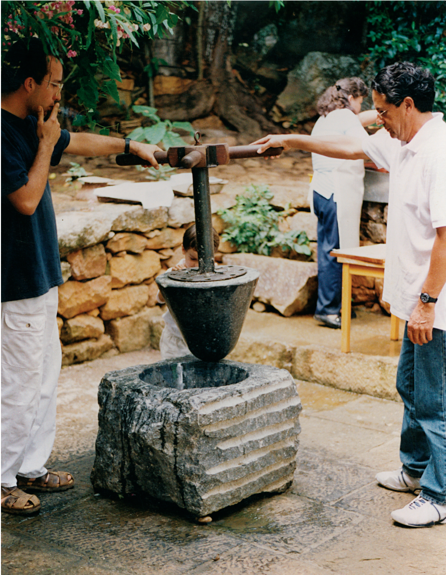
Molino para papel, Barichara, Colombia. 2000.