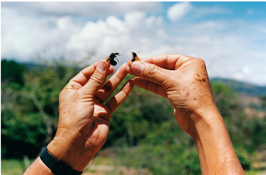
Hormigas Culonas de Barichara, Colombia. De alto contenido de ácido fólico.