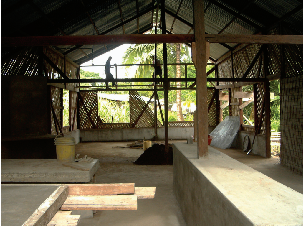
Taller de papel en Jaqué, Panamá.