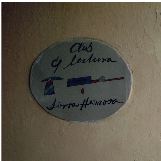
Sierra Hermosa, Zacatecas.