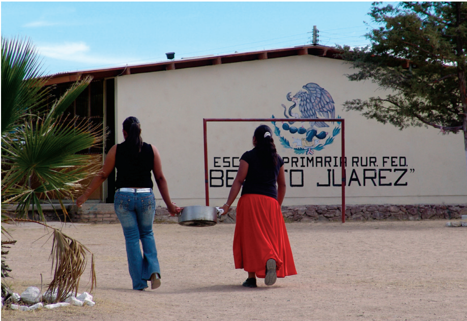
Mujeres haciendo trabajo comunitario en Sierra Hermosa, Zacatecas