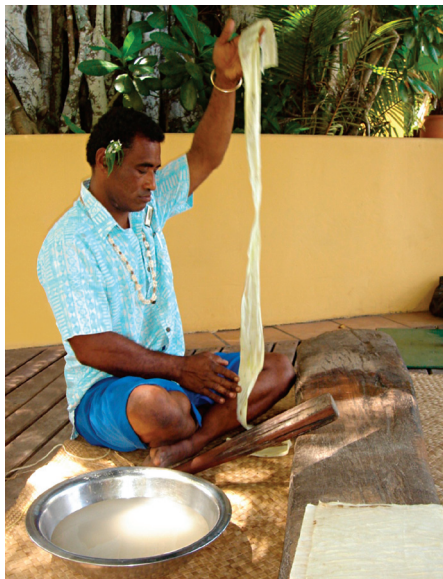
Kevi remojando la fibra en Vatulele, Fiyi.