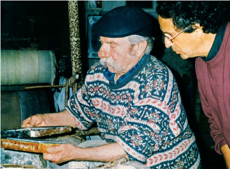
Maestro Papelero de Amalfi, Italia. 2003.