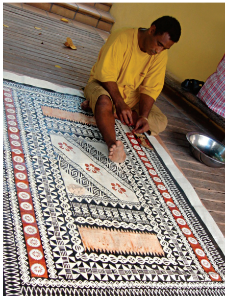
Completando el estarcido de Masi. Vatulele, Fiyi.