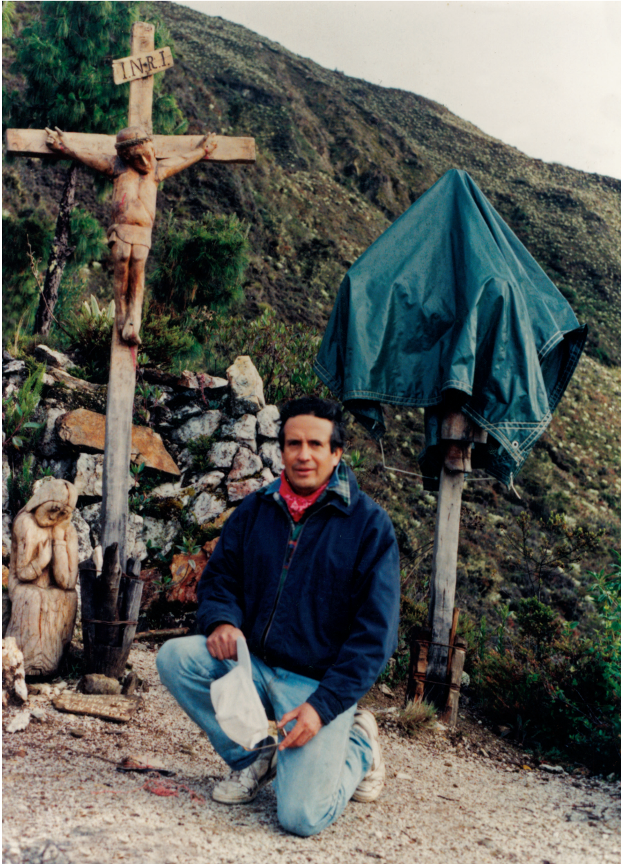
“El Tisure” en los páramos venezolanos.