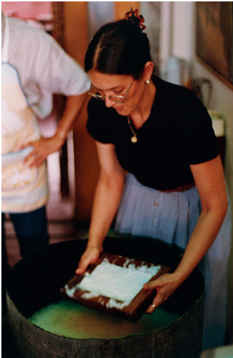
Elaborando papel a mano. Corrientes, Argentina. 2000.