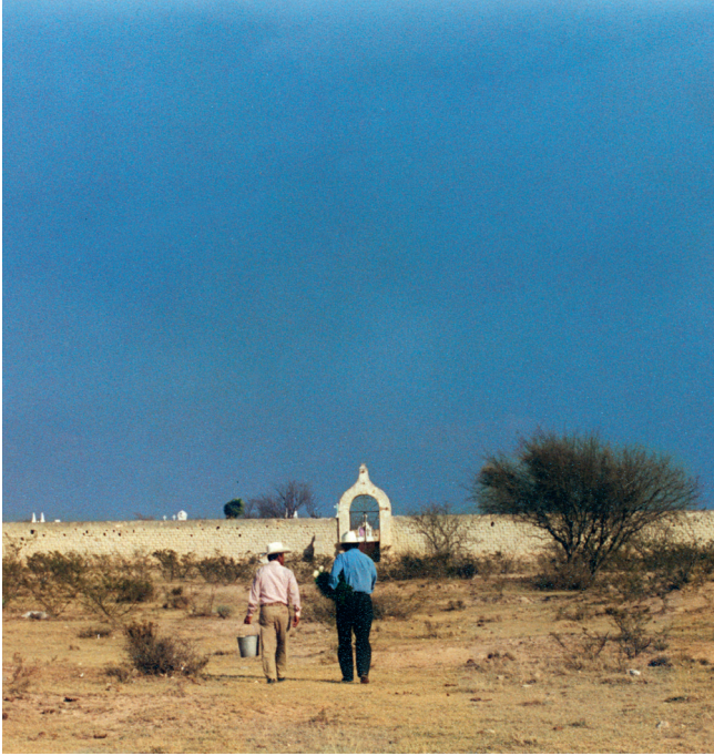
Sierra Hermosa, Zacatecas. 2002.