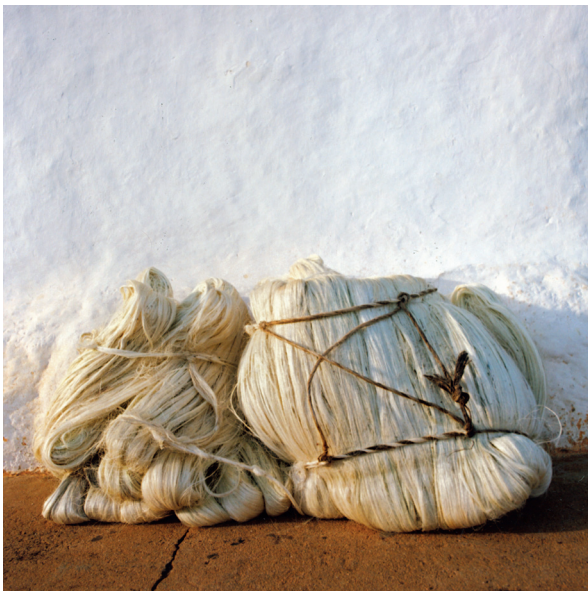
Fibra de fique para papel. Barichara, Colombia.