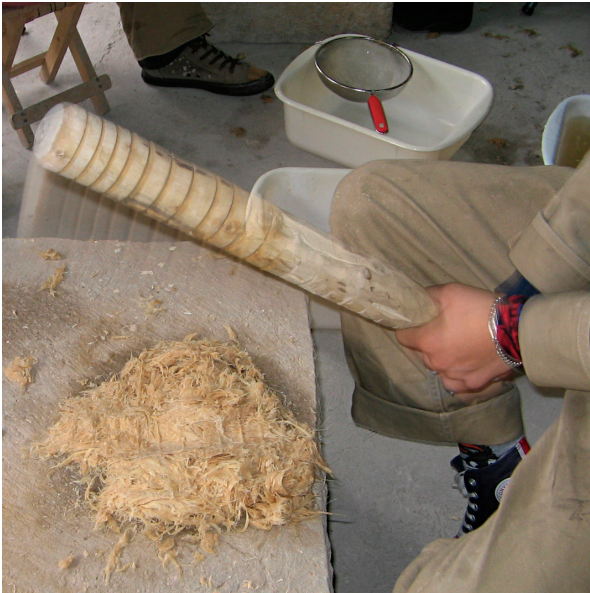
Macerando fibra en la Escuela Taller de Bogotá, Colombia.