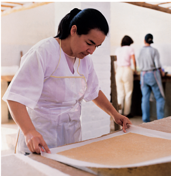
Preparando la hoja para secar. Barichara, Colombia.