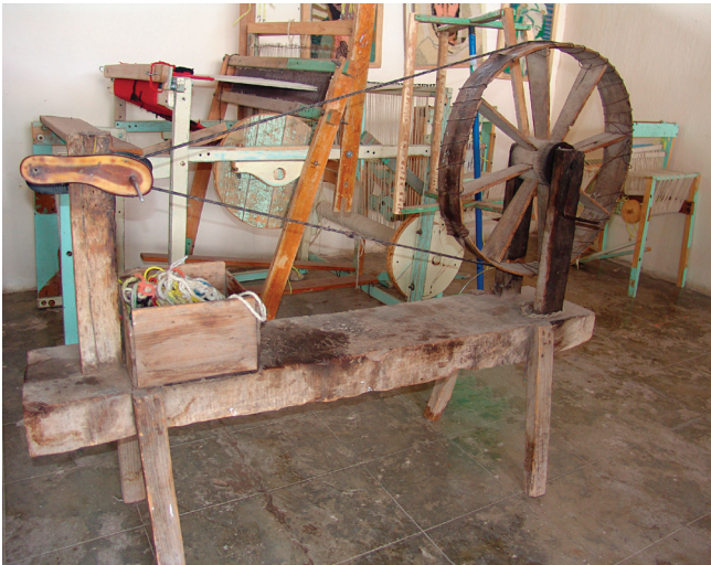
Rueca en el taller textil de Sierra Hermosa, Zacatecas.