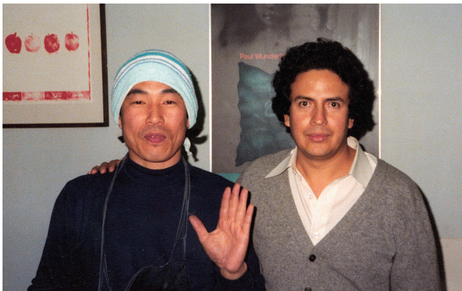
Taller de Grabado. Tokio, Japón. 1980.