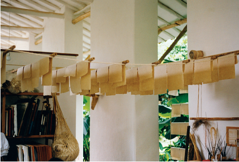
Secado de papel en el Batán. Barichara, Colombia. 2000.