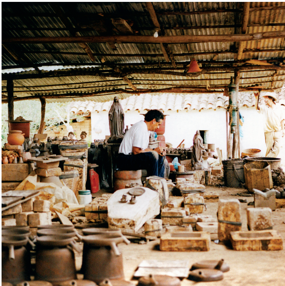
Taller de cerámica "Los Célibes". Santander, Colombia.