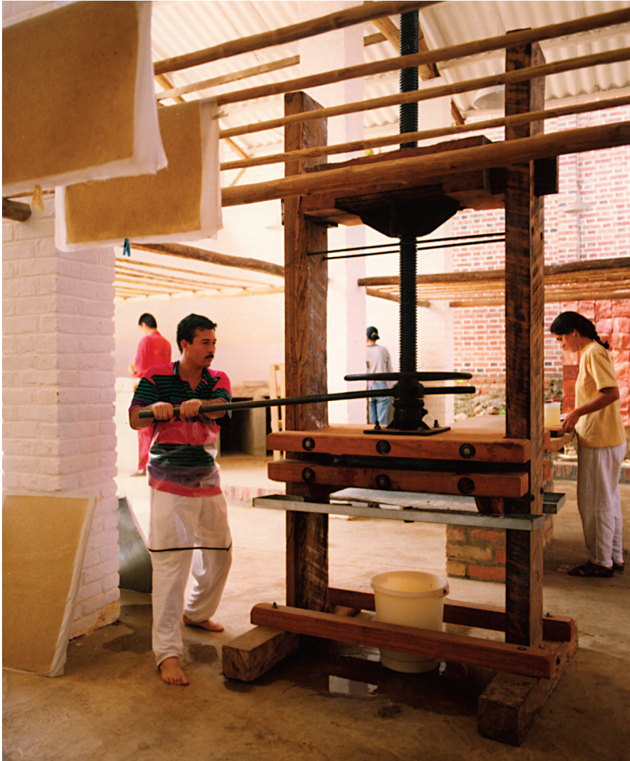
Prensa húmeda. Fundación San Lorenzo de Barichara, Colombia.