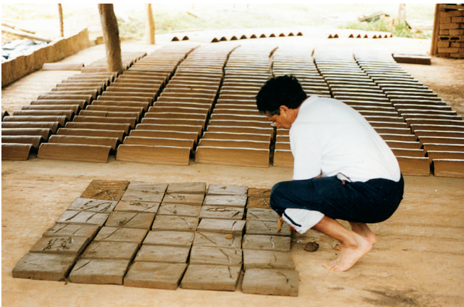
Mural de cerámica. Chircal de Los Célibes. Barichara, Colombia.