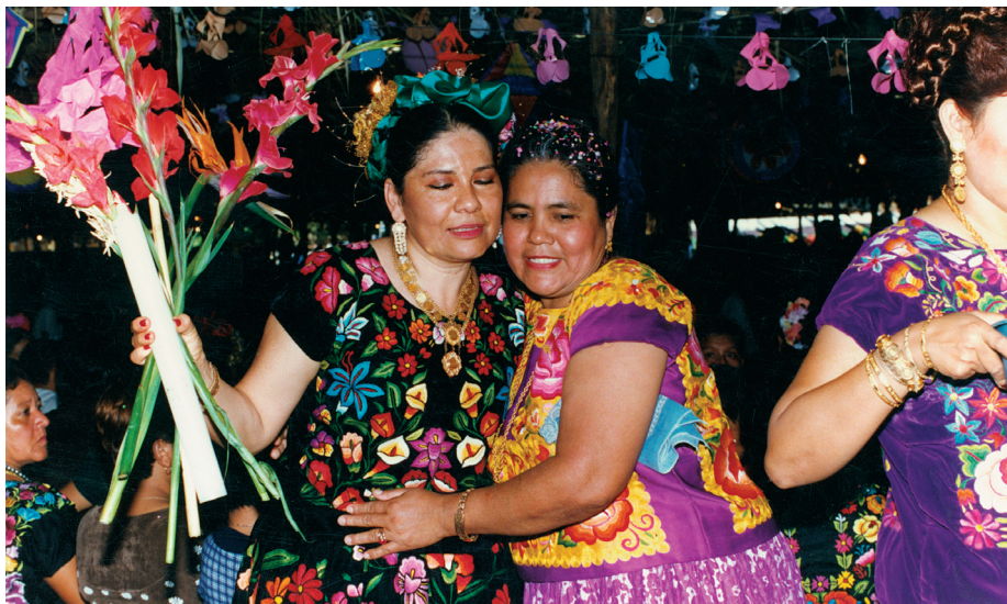
Después de un curso de papel en el Istmo de Tehuantepec, Oaxaca.