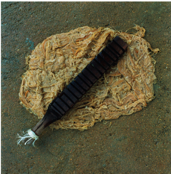
Mazo y fibra de fique o Henequén. Barichara, Colombia.