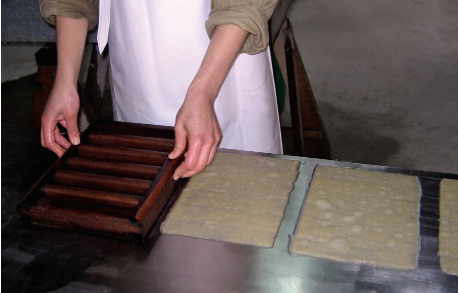
Depositando hojas de henequén. Bogotá, Colombia.